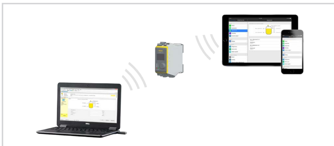
Беспроводное подключение к смартфону/планшету/ноутбуку

Настройка выполняется через бесплатное приложение, доступное для загрузки из "Apple App Store", "Google Play Store" или "Baidu Store". Настройку также можно выполнять через ПО PACTware/DTM на ПК с ОС Windows.